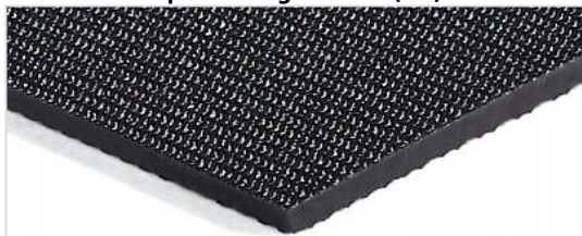
Lado de rodadura: De grano fino (FI)