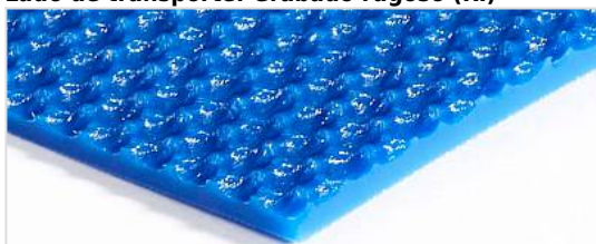
Lado de transporte: Grabado rugoso (RI)