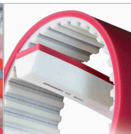
Recubrimientos de PU para polipastos y velas