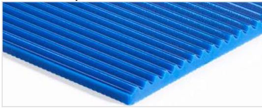
Lado de transporte: Ranuras transversales (TGA)