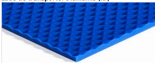
Lado de transporte: Diamante (ID)