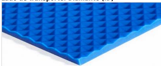
Lado de transporte: Diamante (ID)