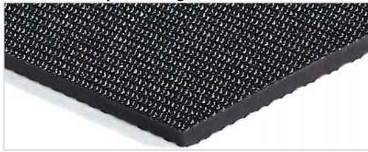
Lado de transporte: Rugoso fino (SR)