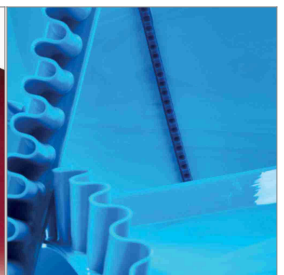
Accesorios de PU para bandas