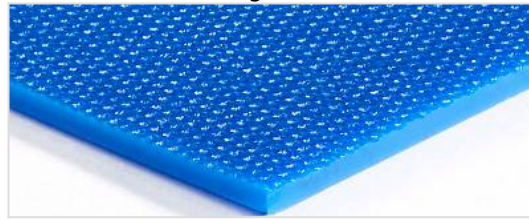
Lado de rodadura: De grano fino (FI)