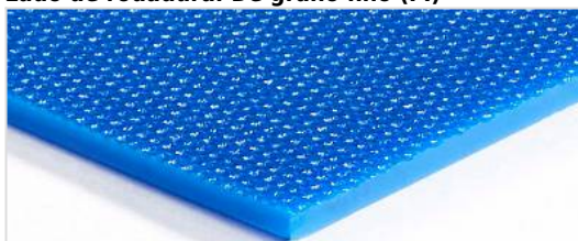
Lado de rodadura: De grano fino (FI)